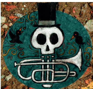
«Canibal Dandies 3 » (2017)