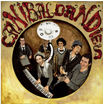
«Canibal Dandies» (2021)